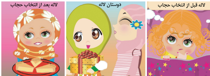
شکل ۲. معرفی شخصیت‌های داستان منظوم پای سیب

● خلاصه داستان: لاله دختری حدوداً ۹ ساله است که تمایلی به رعایت حجاب ندارد. دوستان وی روناک و محدثه، سعی دارند که با اهدای هدیه، ارائه دلیل و روش‌های ایجابی، وی را به حجاب دعوت کنند؛ اما لاله در مقابل دعوت و استدلال دوستانش، واکنش منفی نشان می‌دهد و چند روزی را از آن‌ها فاصله می‌گیرد. طی این چند روز، اتفاقاتی نظیر مشاهده تفاوت بارز رفتار فروشنده‌ای آقا، نسبت به خود و دختری محجبه و تفکری عمیق بعد از جدال درونی خویش، نظر خود را نسبت به حجاب تغییر می‌دهد و برای آشتی با دوستانش، برای آن‌ها کیک پای سیب می‌برد. در این کتاب پنج راهبرد برای پذیرش حجاب از سوی مخاطبان ارائه شد. (الف) نوعی استدلال عقلانی (اقناع) ناظر بر اذیت نشدن و ایجاد مزاحمت در اثر بدحجابی؛ (ب) استدلال نقلی ناظر بر ضرورت پذیرش امر پروردگار به‌عنوان واجب شرعی؛ (پ) درک پیامدهای بی‌حجابی از طریق یادگیری مشاهده‌ای و عاقبت‌اندیشی؛ (ت) تأثیر‌گذاری عاطفی از طریق صحبت برای تغییر رفتار (هدیه دادن) و (ث) تقویت اراده‌ورزی و ارائه تصویر پیروزی عقل، بر نفس اماره توسط نویسنده داستان.